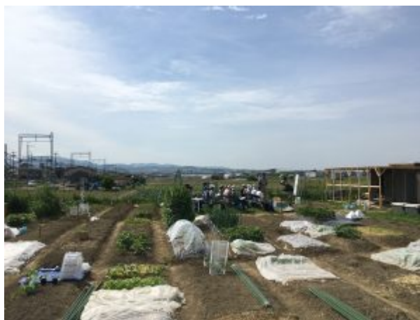
Photo 3: Un dimanche sur la parcelle de pratique du Small Farmer College. Dans le fond, les étudiants suivent un cours sur les ravageurs de la tomate avant de repiquer leurs plants.

souhaitent produire à petite échelle pendant leur temps libre ». Après quelques temps il réalise que, pour donner une envergure commerciale à leur production agricole et pour approfondir leurs connaissances, il faut passer à un niveau supérieur. C'est comme ça qu'est né le Small Farmer College.