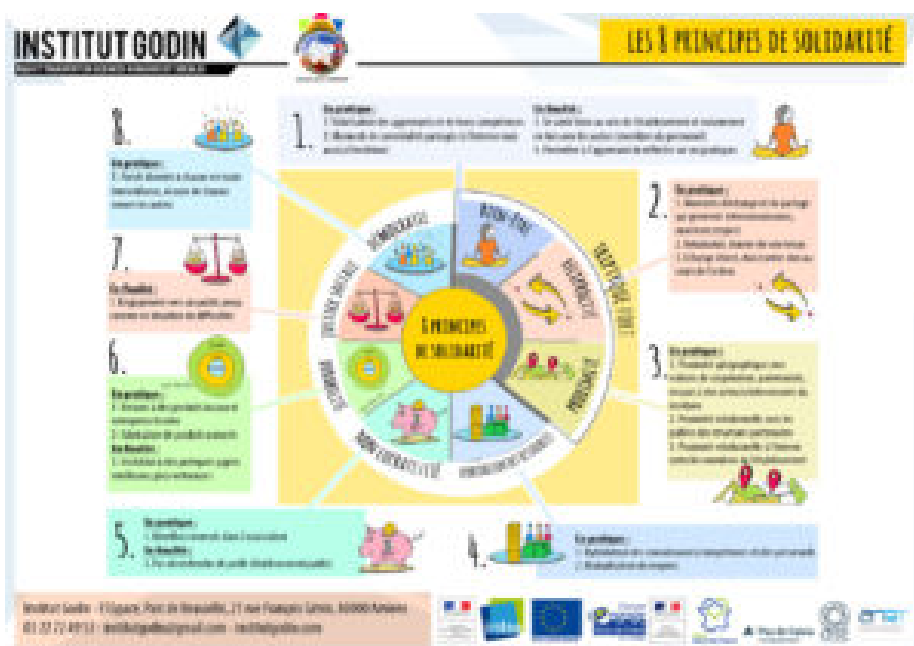
Figure 2 – La roue des principes de solidarité

Au-delà des 8 principes, c'est la mise en travail de ceux-ci qui est visée, en termes de pratiques (ex : « échanges directs, don/contre-don au cours de l'action ») et/ou de finalités (ex : « engagement vers un public perçu comme en situation de difficultés »). Cela a donné lieu à « la roue des principes de solidarité » (fig. 2) qui décline chaque principe en exemples de pratiques et/ou en finalité recherchée.