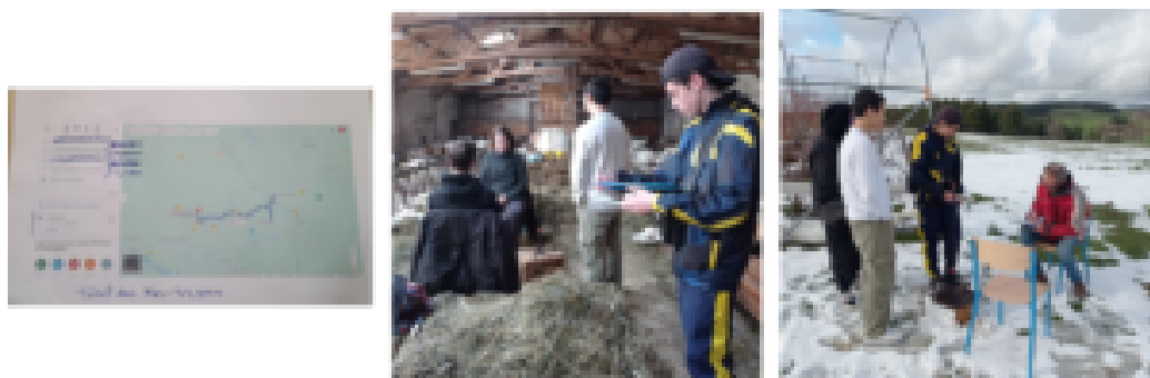
Figure 3 – Les

déroulent bien : aucun tracas logistique, des élèves parties prenantes et enthousiastes, les interviews réalisées. Cette enquête est vécue comme un évènement motivant pour les jeunes et leurs enseignants ; certains élèves se révèlent bien plus dynamiques et impliqués qu'en cours.