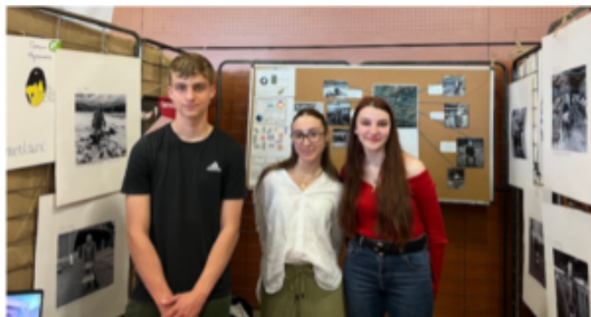
Figure 5 – Les élèves témoins au festival We Can à Belleville en Beaujolais

été nommés pour présenter brièvement ce projet collectif aux membres de jury, le promouvoir et les convaincre de son intérêt. L'occasion d'une répétition en situation réelle avant d'envisager l'évaluation CCF, la remise et la présentation des livrables au commanditaire, ainsi que leur présentation aux agriculteurs participants.