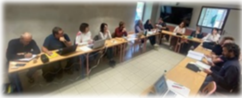
Figure 1 – L'équipe enseignante réunie pour un des ateliers de travail