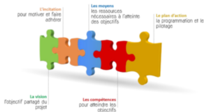
Figure 87 - les composantes du changement (Farmakis, 2013)

du changement de Farmakis , qui envisage un changement dépendant de cinq facteurs : la vision, l'incitation, les moyens, les compétences et le plan d'action.